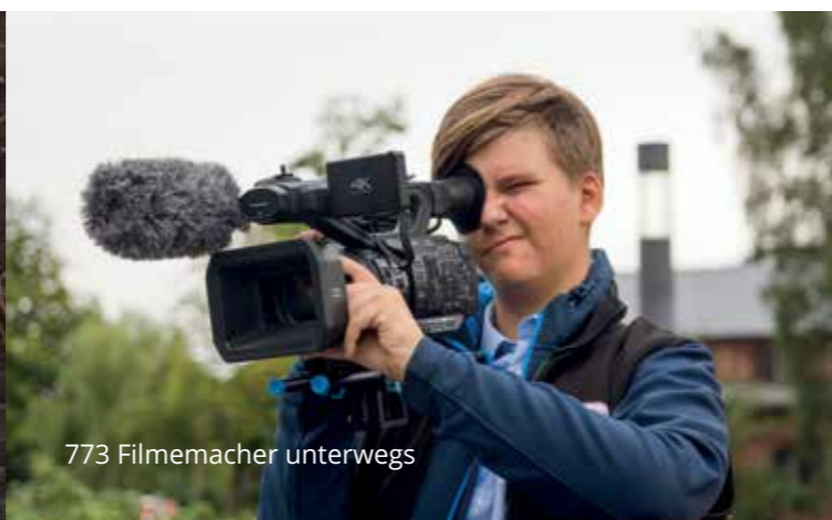
773 Filmemacher unterwegs