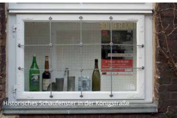
Historisches Schaufenster in der Königstraße

Aktuelle Informationen zu Sonderausstellungen, Führungen, Vorträgen und Aktionen erhalten Sie unter www.koenigstrasse-elmshorn.de