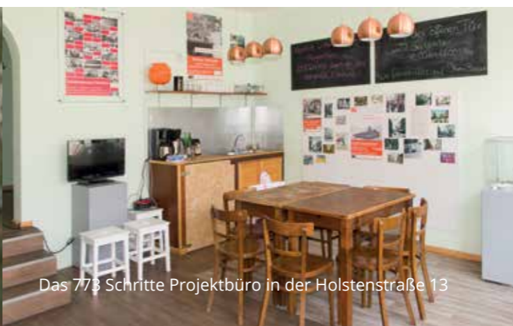
Das 773 Schritte Projektbüro in der Holstenstraße 13