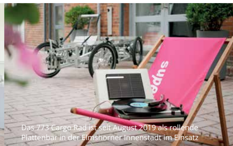
Das 773 Cargo Rad ist seit August 2019 als rollende Plattenbar in der Elmshorner Innenstadt im Einsatz